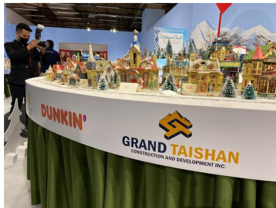
クリスマスの街を作り 寄付を集める