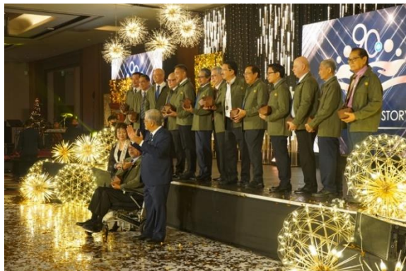
セブ・ロータリークラブ90周年記念式典