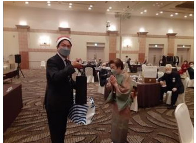
当日賞の大当たり