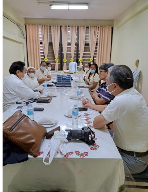
1 時間学校の事を伺いました