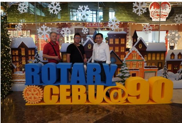
セブ RC 奉仕活動の報告会