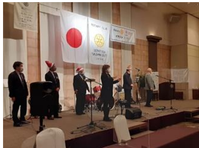
福島南ロータリーの歌