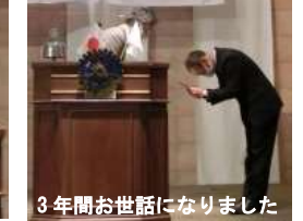
3年間お世話になりました