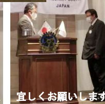
宜しくお願ひします