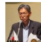
奉仕プロジェクト