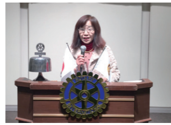
1月ロータリーの友読みどころ