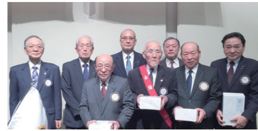
1月誕生日のお祝い