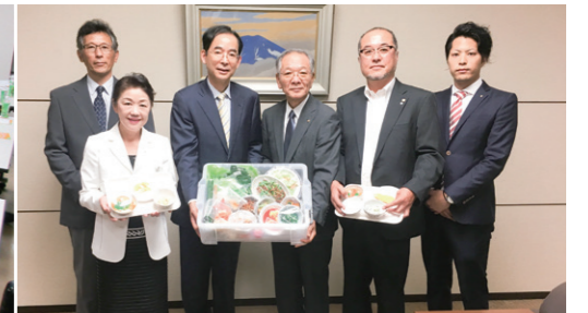
福島市役所にてフードモデル贈呈式