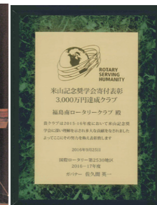
米山記念奨学会寄附表彰状