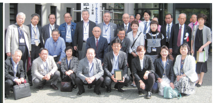
ユラックス熱海正面玄関にて