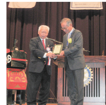
米山記念奨学会寄附 3,000万円達成クラブ表彰風景