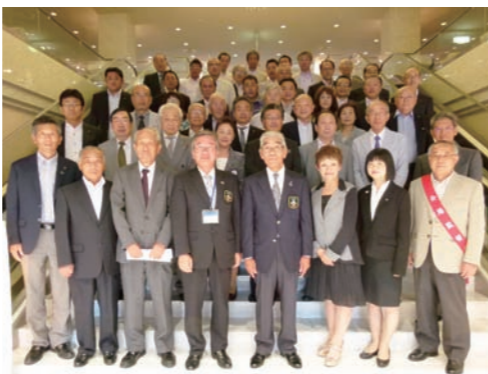
「一年間、宜しくお願いします」