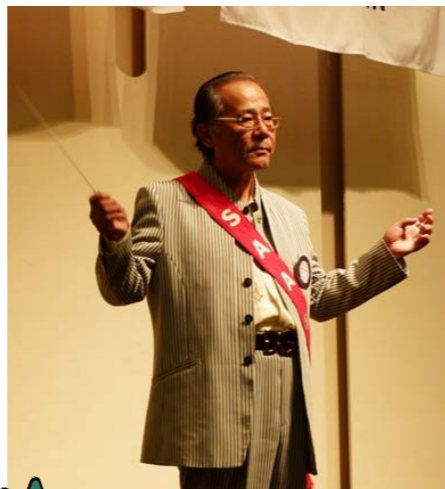
「初めてのソングリーダーとは思えない 見事なタクトさばきでした。」