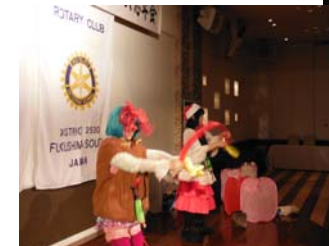
パフォーマー登場