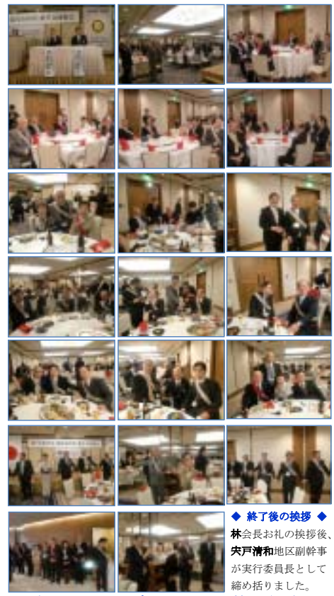
◆ おりおりにて 南ロータリークラブ新年会 ◆