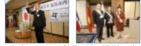
◆ 南ロータリークラブ会員の皆様、ご苦労さん ◆