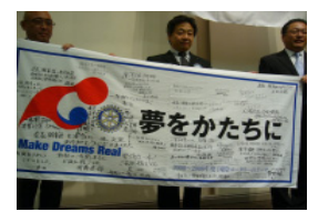
ご苦労さまでした。