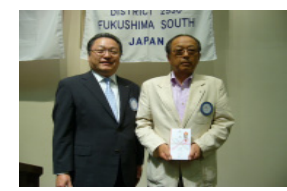
おめでとうございます。