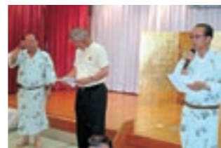
ゴルフ部会表彰式