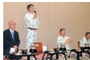
開会挨拶 廣澤会長