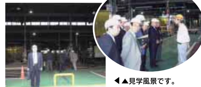
◀見学風景です。皆さん真剣です！