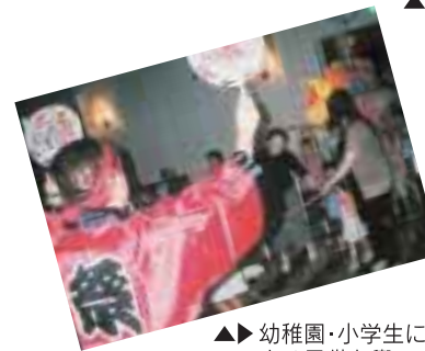
▲幼稚園・小学生による子供お興